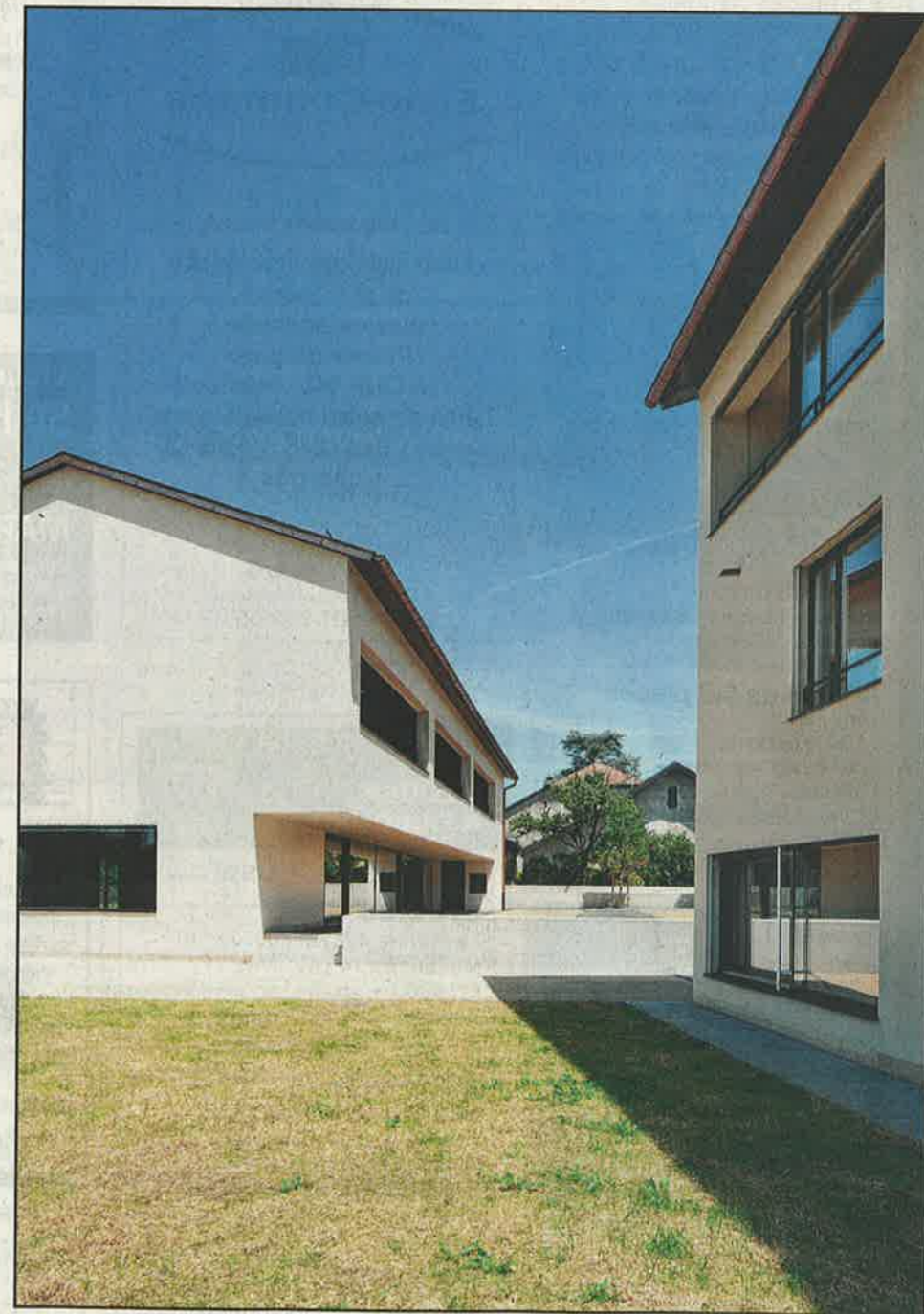
Les premiers bâtiments sont orientés d'est en ouest et offrent quinze appartements traversants.